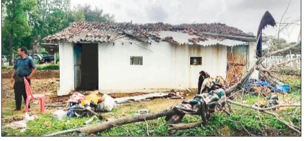
क्षतिग्रस्त घर, बाहर फेंके गए सामान।

ग्राम पंचायत मदनपुर में विवादित भूमि पर अवैध कब्जा लेने की नियत से भू माफिया व उसके गुणों ने घर में अ के ली महिला व उसके पुत्र पर लाठे की रौंद व सबल, लाठी से जानलेवा हमला कर दिया। मारपीट से घायल महिला व उसके पुत्र ने भू-माफिया के चंगुल से भाग कर जान बचाई। घटना की रिपोर्ट पर पुलिस ने अपराध दर्ज किया है।