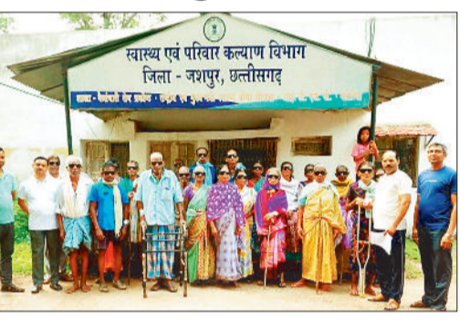
नि.शुल्क ऑपरेशन के बाद मरीज।