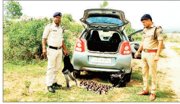
कार से जब प्रतिबंधित कफ सीरप।

ध्वस्त कर दिया है। घर में रखा धान थोड़ी दूर लेकर खाया और बर्बाद किया। बड़ी मशकत से हाथी को भगाया जा सका। ज्ञात हो कि कुनकुरी रेंज के चराईमारा जंगल में विगत डेढ़ माह से हाथी अपना डेरा जमाए हुए हैं। हाथी से रानीकोम्बो, सारंगडांड, पुटुकेला, सतीतला, मटासी, टांगर टोली, बोड़ालता आदि गांवों के ग्रामीण जंगली हाथियों से परेशान है और रातजगा करने में मजबूर हैं। सभी गांव के ग्रामीण वन विभाग के कर्मचारियों द्वारा हाथी भगाने के लिए टार्च की व्यवस्था नहीं करने से सभी खासा नाराज चल रहे हैं। कुछ दिनों से वन विभाग की टीम इस क्षेत्र में गस्ती तो जरूर कर रही है पर रात को हाथी किस गांव में प्रवेश किया है उसका पता लगाने में फेल हो रही है। वन विभाग के गस्ती के वाजजूद भी हाथी के द्वारा मकानों को तोड़ने से रोक नहीं पा रही है।