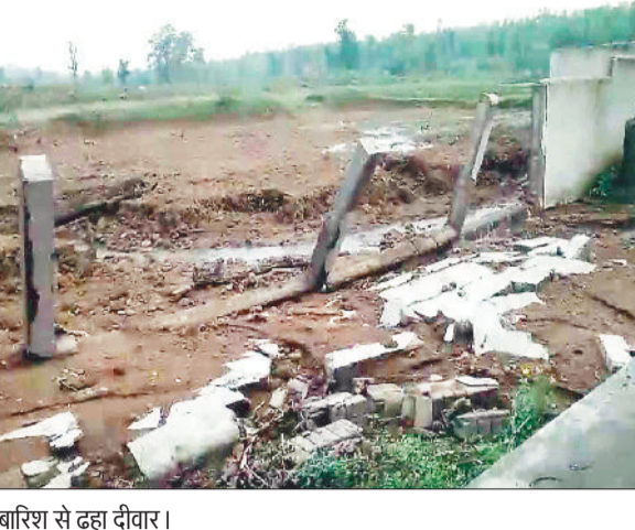
बारिश से ढहा दीवार।