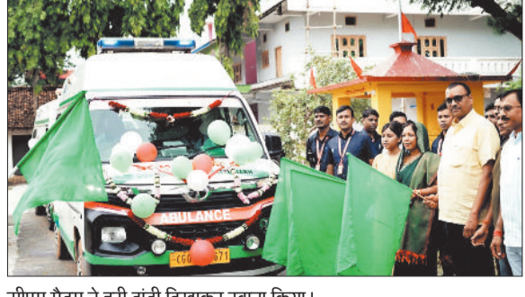
सीएम मंडम ने हरी झंडी दिखाकर रवाना किया।

जशपुरनगर। मुख्यमंत्री विष्णुदेव साय के घोषणा के अनुरूप स्वास्थ्य सेवा के क्षेत्र में जिले को दो बड़ी सुविधा मिली है। मुख्यमंत्री की जशपुर सहित प्रदेश में तेजी से सुघर रहा सोमवार को स्वास्थ्य सेवा