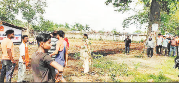
घटना स्थल पर मौजूद पुलिस व लोगों की भीड़।