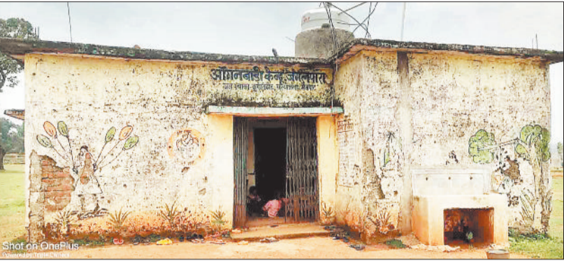
आंबा केन्द्र जंगलपारा में संचालित प्राथमिक शाला।

शासन द्वारा करोड़ों रूपए खर्च करने के बावजूद स्कूल भवनों की स्थिति में सुधार नहीं हो सका है। जर्जर भवनों में अ प ना भ वि ष य ग ढ ने वा ले बच्चों की सुरक्षा के लिए विभाग ने वैकल्पिक भवनों में उनकी पढ़ाई की व्यवस्था की है। हालात यह है कि कहीं अतिरिक्त कमरे में एक साथ पांच कक्षाओं के बच्चे भेड़-बकरियों की तरह पढ़ाई करने मजबूर हैं तो भवन की व्यवस्था नहीं होने के कारण टपकते छत के नीचे बैठकर बच्चे अपना भविष्य गढ़ने की मशक्कत कर रहे हैं। जिन स्कूलों में बच्चों के बैठने तक की व्यवस्था नहीं है वहां बच्चों को गुणवत्तापूर्ण शिक्षा उपलब्ध कराने की बात पर हैरानी होती है। विकासखण्ड मैनेपाट में तीन दर्जन से अधिक स्कूल भवन अत्यंत जर्जर थे। शिक्षक वर्षों से जर्जर भवन की समस्या से अधिकारियों को अवगत करा रहे थे लेकिन विभाग न तो भवनों की मरम्मत करा पा रहा था न ही नए भवन के निर्माण की पहल। पिछले साल राज्य सरकार ने ऐसे